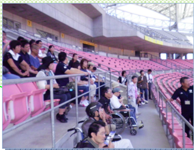
東北電力ビッグスワン スタジアム

9月28日(金)、新潟方面への日帰り旅行に行ってきました。天気の良い絶好の日になり、最初はビッグスワンスタジアムの見学でした。貴賓室や試合前日の準備をしているピッチの様子等を見ることが出来ました。新潟ふるさと村では、みんなと一緒に昼食を摂り、お土産を買いました。午後からは、白根グレープガーデンでぶどう狩りでした。ぶどう狩りの出来る所までは、予想以上に遠くて不便でしたが、美味しそうなぶどうを一房、無料で採る事が出来ました。とても楽しい旅行でした。