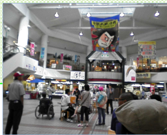
お土産 コーナーがたくさん ありました