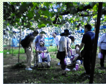
広いぶどう園でした