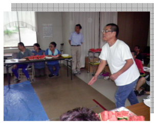
すいかの皮投げ 的になかなか入らず、距離がだ んだん短くなってきました。