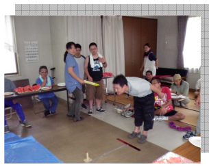
すいかの種飛ばし 気合と共に、どこまでも 飛んで行け!