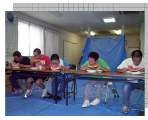
きれいに早食い あまりにも時間が短すぎ た感じでした。