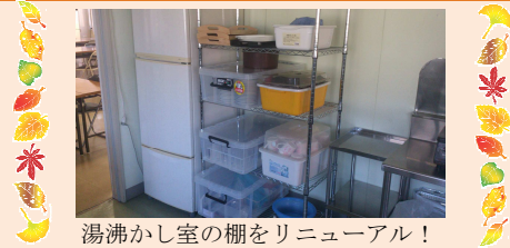
湯沸かし室の棚をリニューアル！

室内のスペースを有効に利用する為、作業場に置いてある棚と、湯沸かし室の食器棚を新しくしました。作業場は快適に作業ができるようになりました。また、湯沸かし室では使用していない食器を処分しました。それぞれ綺麗になり、使い易くなりました。